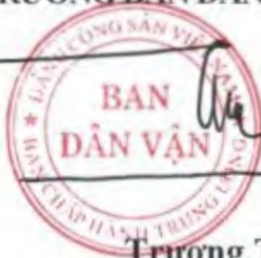
Trương Thị Mai

TRƯỞNG BAN DÂN VẬN TRUNG ƯƠNG CHỦ NHIỆM TỔNG CỤC CHÍNH TRỊ